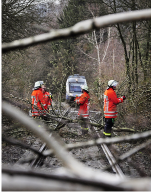
Von Maximilian Wehner

„Niklas“ fegt durchs Weserbergland: Eine Person verletzt - Bahn prallt gegen Baum